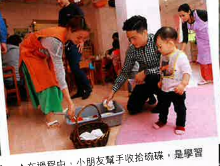
在過程中，小朋友幫手收拾碗碟，是學習自理的第一步。