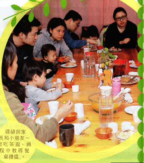
導師與家長和小朋友一起吃茶點，過程中教導、餐桌禮儀。