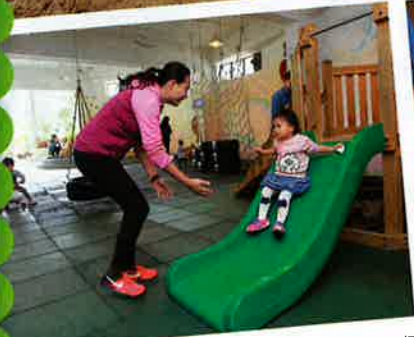
小朋友參加暑期班，從遊玩中學習，過得充實。