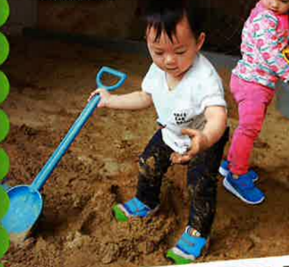
在沙池可以大玩沙，實在是難得的機會。

家長們認同中心舉辦的暑期班，更體驗「華德福教學理念」，在舒適的環境下，旨在令小朋友體驗更多。