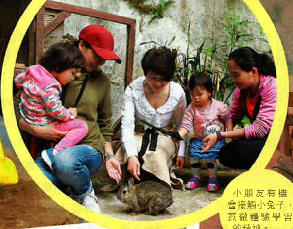
小朋友有機會接觸小兔子，貫徹體驗學習的精神。